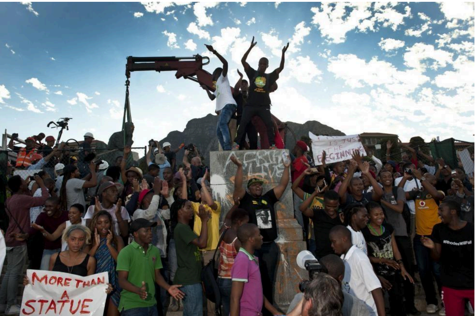
Rhodes Must Fall - South Africa - Students celebrate as Rhodes statue is being taken down.

ppgcom/ufmg luciana de oliveira 60 h/a - 2024_1